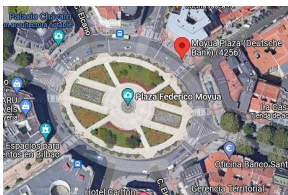
BILBAO (Plaza Moyua)