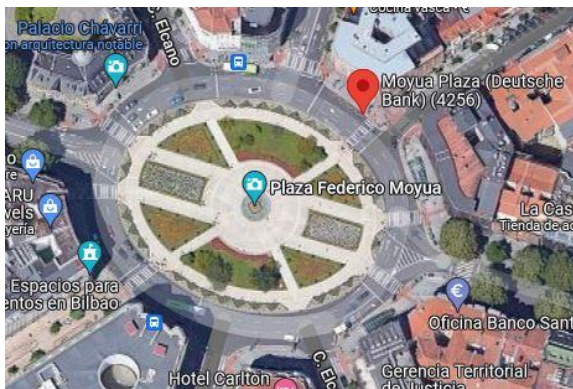
BILBAO (Plaza Moyua)